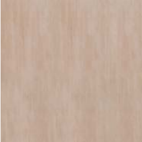
MHJO CULT BEIGE RETTIFICATO 60x60