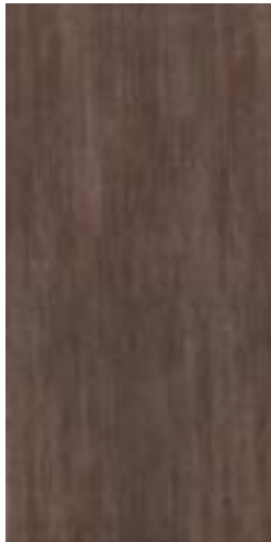
MHIY CULT BROWN RETT. 30x60