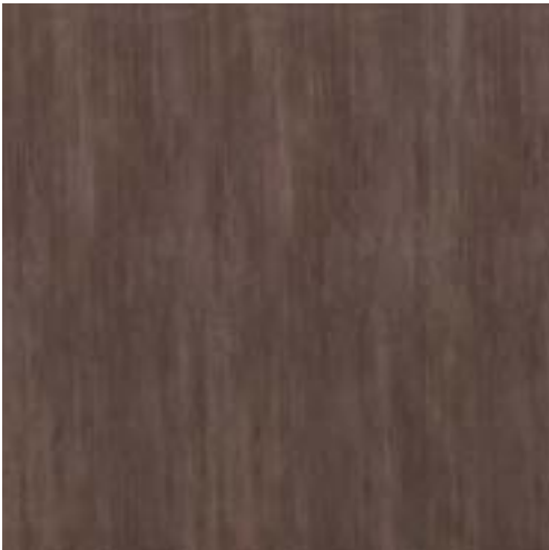
MHJS CULT BROWN RETTIFICATO 60x60