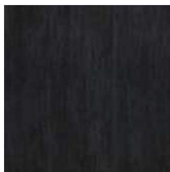
MJFA CULT BLACK 40x40