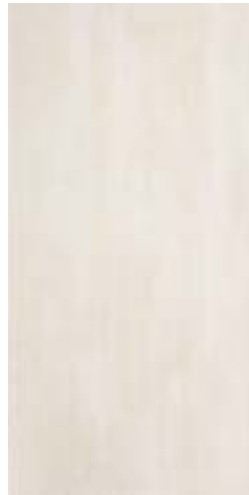
MHIW CULT OFF WHITE RETT. 30x60