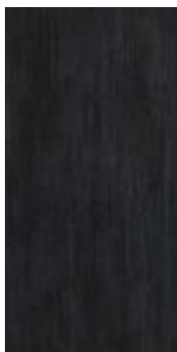
MHJB CULT BLACK RETT. 30x60