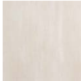
MJF6 CULT OFF WHITE 40x40