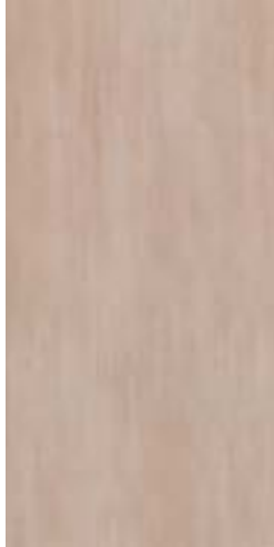
MHIX CULT BEIGE RETT. 30x60