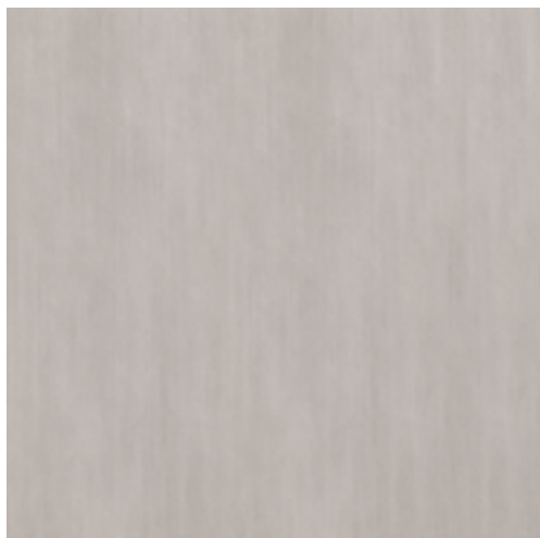
MHKB CULT GRAY RETTIFICATO 60x60

GRES PORCELLANATO SMALTATO | GLAZED PORCELAIN STONEWARE GRÈS CÉRAMÉ ÉMAILLÉ | GLASIERTES FEINSTEINZEUG GRES PORCELÁNICO ESMALTADO | ГЛАЗУРОВАННЫЙ КЕРАМОГРАНИТ