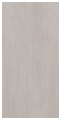
MHIZ CULT GRAY RETT. 30x60