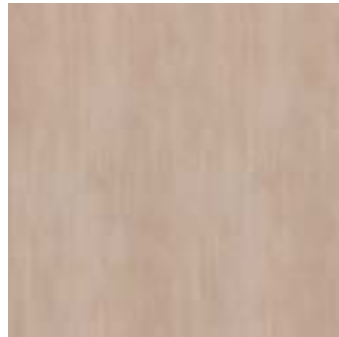
MJF9 CULT BEIGE 40x40