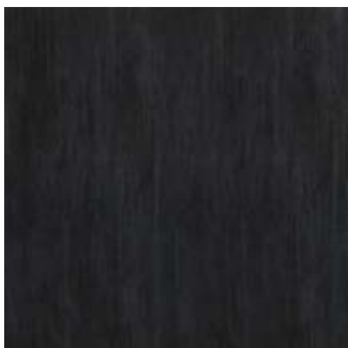
MHKI CULT BLACK RETTIFICATO 60x60