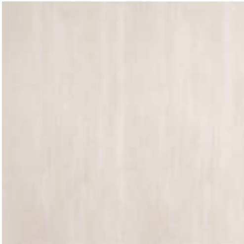
MHJI CULT OFF WHITE RETTIFICATO 60x60